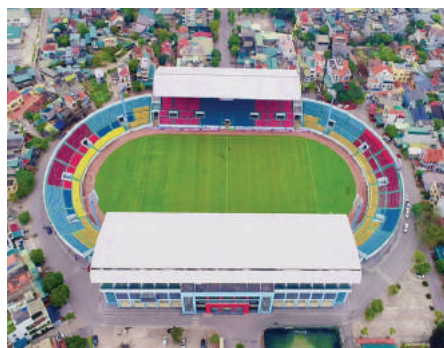
Sân vận động Cẩm Phả được đầu tư mái che, thảm cỏ đạt tiêu chuẩn quốc tế, là nơi thi đấu của môn bóng đá nữ.