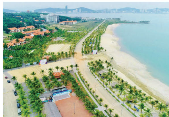
Tuần Châu cũng là nơi được chọn tổ chức môn thi đấu 3 môn phối hợp (bơi, chạy và xe đạp).

Nằm ngay cửa ngõ TP Hạ Long, Nhà thi đấu thể thao đa năng 5.000 chỗ (phường Đại Yên, TP Hạ Long) hiện đại, đạt đẳng cấp quốc tế sẽ là nơi tổ chức thi đấu môn bóng chuyền trong nhà.