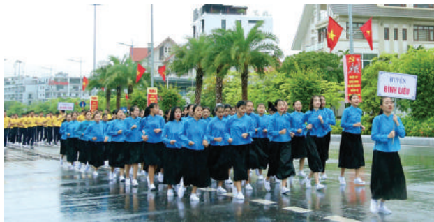
Lễ phát động Cuộc vận động "Toàn dân rèn luyện thân thể theo gương Bác Hồ vĩ đại", Ngày chạy Olympic vì sức khỏe toàn dân, Giải Việt dã truyền thống và Giải chạy tập thể thường niên của tỉnh năm nay sẽ gắn với sự kiện hưởng ứng SEA Games 31. (Ảnh chụp sự kiện năm 2021).