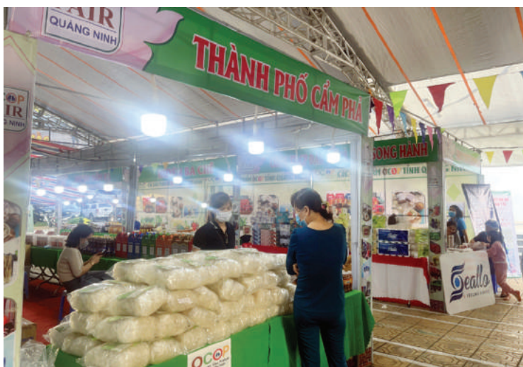
Tuần bán hàng trực tuyến sản phẩm OCOP và sản phẩm thủy sản tổ chức tháng 11/2021 tại TP Cẩm Phả.

Tuy đã đạt những kết quả như vậy, nhưng có thể thấy, OCOP Cẩm Phả còn nhiều điểm cần khắc phục như phát triển chưa tương xứng, nhỏ lẻ, chất lượng chưa cao, tình cạnh tranh kém, các chuỗi từ sản xuất, bảo quản, chế biến đến tiêu thụ sản phẩm còn ít, một số nghị quyết, chính sách chưa được triển khai hiệu quả vào việc hỗ trợ các doanh nghiệp... Đây là điều thành phố cùng các doanh nghiệp cần tháo gỡ, khắc phục trong thời gian tới.