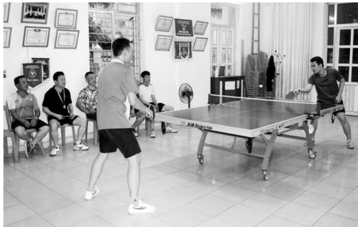
Nhà văn hóa khu Minh Tiến B, phường Cẩm Bình hoạt động đều đặn từ sự vào cuộc của nhiều VĐV là công nhân các đơn vị sản xuất than trên địa bàn.

Vậy là phong trào văn hóa thể thao của ngành than đã trở thành nòng cốt cho hoạt động của nhiều nhà văn hóa phường ở TP Cẩm Phả. Các VĐV ngành Than không chỉ tham gia hoạt động ở các nhà văn hóa hàng ngày mà còn giúp cho các cán bộ khu phố làm tốt hơn công tác xã hội hóa, như khi cần sửa sang, chỉnh chu hơn nhà văn hóa thì có sự đóng góp không nhỏ của họ.