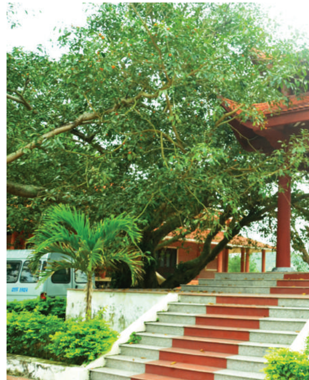
Nhà bia ghi dấu sự kiện Bác Hồ ra thăm đảo Ngọc

Nằm trong các hoạt động kỷ niệm 60 năm ngày Bác UBND huyện Vân Đồn đã có chủ trương hoàn thiện nhận Khu di tích lưu niệm Bác Hồ trên đảo Ngọc V