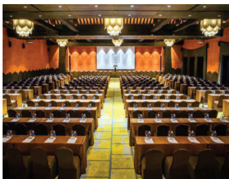
Phòng Diên Hồng (Legacy Yên Tử) được thiết kế hiện đại, sẵn sàng cho các VĐV cờ tướng trở tài.

Chuẩn bị cho sự kiện thể thao lớn này, tỉnh Quảng Ninh đã đầu tư cải tạo, nâng cấp những công trình, nhà thi đấu, sân vận động hiện đại, khang trang nhất để đón tiếp đoàn thể thao các nước trong khu vực. Hầu hết những địa điểm thi đấu này không chỉ hiện đại, đủ tiêu chuẩn tổ chức các sự kiện thể thao quốc tế, mà còn là những điểm check-in nằm trong những điểm tham quan du lịch nổi tiếng nhất của Quảng Ninh.