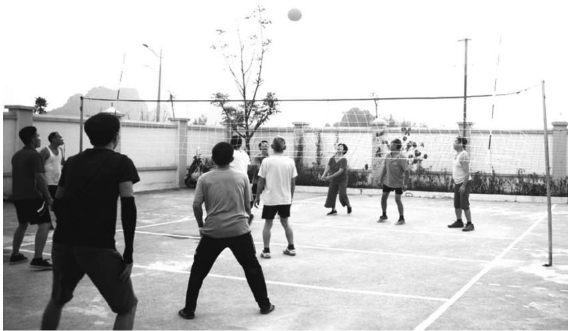
Người dân chơi bóng chuyền hơi ở Nhà văn hóa khu phố Cao Sơn 3, phường Cẩm Sơn (TP Cẩm Phả).