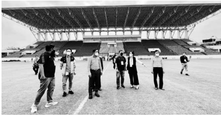
Các trưởng đoàn dự SEA Games kiểm tra, đánh giá cơ sở vật chất SVĐ Cẩm Phả và các điểm thi đấu khác của Quảng Ninh.

Quảng Ninh sẽ đăng cai tổ chức 7/40 môn thi đấu SEA Games 31, nhiều thứ 2 chỉ sau thủ đô Hà Nội. Dù còn khoảng hơn 1 tháng nữa mới diễn ra khai mạc nhưng tới thời điểm này, công tác chuẩn bị cho SEA Games đang được tỉnh triển khai tích cực.