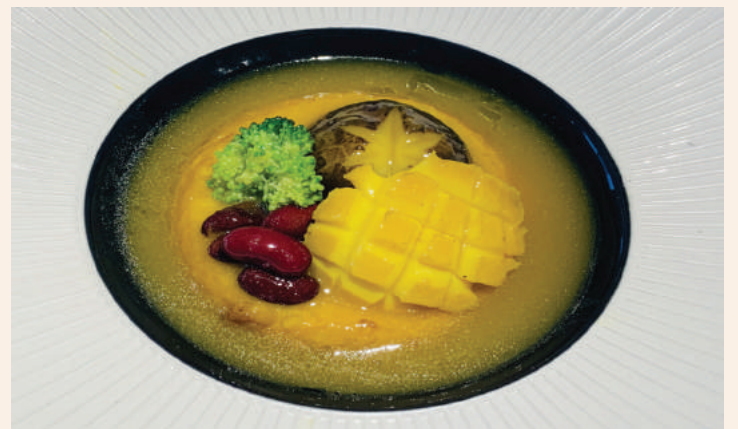
Món bào ngư sốt hồng xíu hấp dẫn người thưởng thức từ ánh nhìn đầu tiên bởi hình thức đẹp, bắt mắt và sẽ lưu luyến bởi hương vị tinh tế, mới lạ.

Thái quả dành dành, cho vào nước hầm xương để tạo màu vàng tươi cho món ăn thêm hấp dẫn. Thêm chút bột năng để tạo độ sệt sệt cho