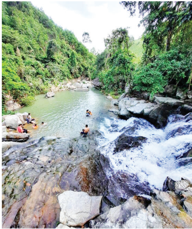
Về mùa hè, thác Khe San là nơi tìm đến của nhiều bạn trẻ vào mỗi buổi chiều.

Do chưa bị tác động bởi bàn tay con người, nên thác Khe San vẫn còn mang nét hoang sơ nguyên thủy như từ khi tạo hóa tạo ra nó. Thác có nhiều ghềnh đá lớn, in bóng những cây hoang dại mọc tự nhiên ven bờ. Dòng nước tạo thành thác Khe San được đổ về từ các dòng suối Phài Giác, Khe Quang thuộc các thôn Phài Giác, Khe Quang của xã Đại Dục (Tiên Yên). Đến xã Phong Dụ, dòng nước vượt qua nhiều tầng đá lớn nhấp nhô đủ hình thù, uốn theo như dải lụa trắng rồi bất ngờ đổ xuống tạo thành thác.