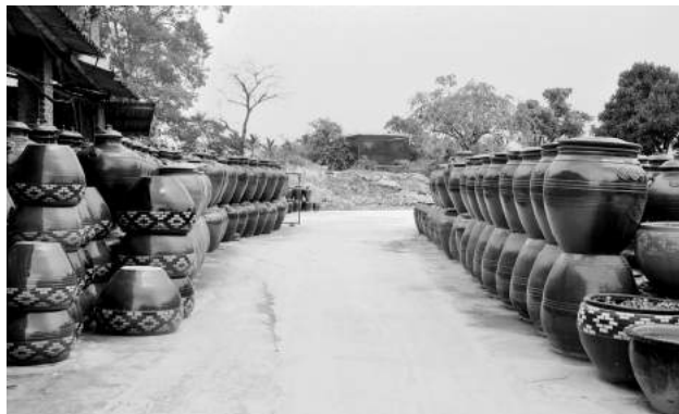
Sản phẩm gốm truyền thống Đông Triều chủ yếu là sản phẩm to, nung nặng lửa bền, chắc.

Ngắm khu trưng bày và xưởng sản xuất nơi