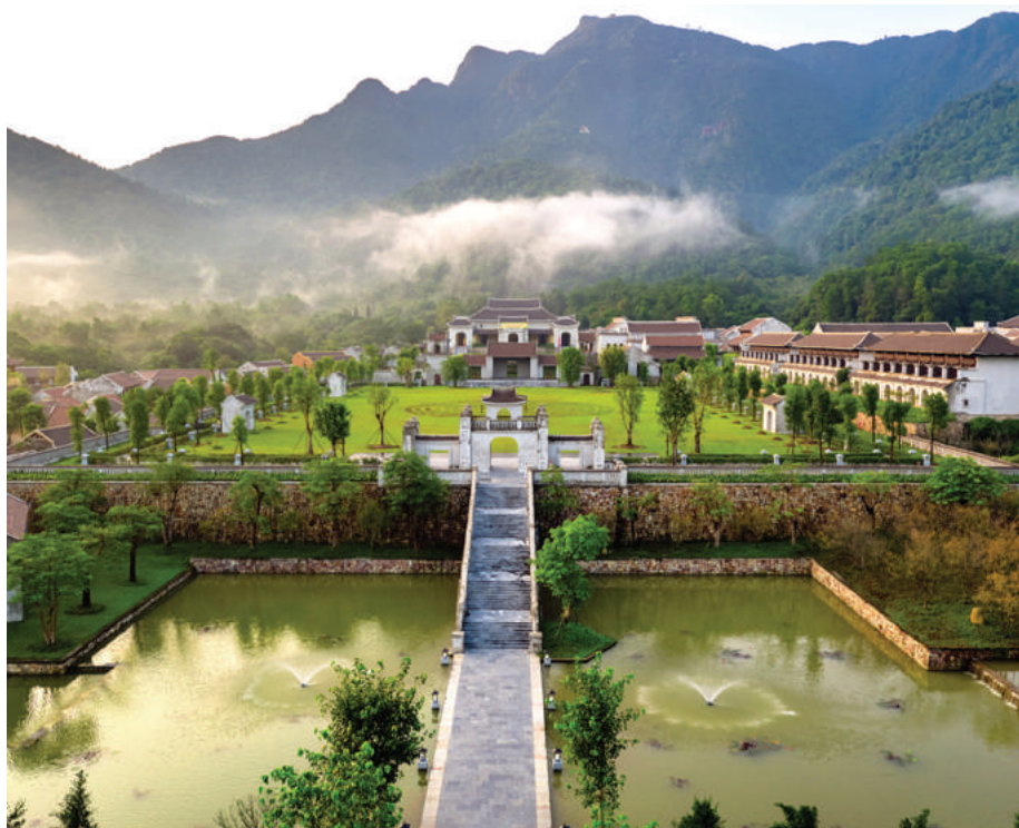
Legacy Yên Tử dưới chân non thiêng thích hợp để được chọn là nơi tổ chức môn thi đấu cờ tướng.