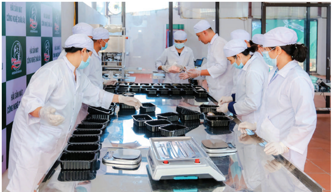
Sản xuất hải sản mát ở Công ty Green Aquatech, TP Cẩm Phả.

Nhờ đó, dù trải qua nhiều khó khăn, nhưng từ năm 2021 tới nay, TP Cẩm Phả vẫn có 4 tổ chức, cá nhân tham gia OCOP, nâng tổng số đơn vị tham gia OCOP lên con số 14. Một số doanh nghiệp có tiềm lực, đầu tư lớn như: Công CP Du