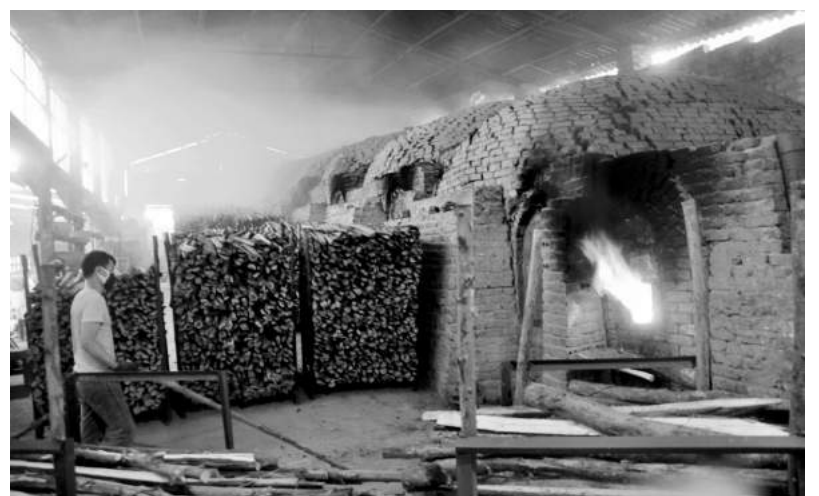
Hệ thống lò bầu đun bằng củi gỗ có giá thành thấp, phù hợp với sản phẩm gốm to của Đông Triều nhưng tiềm ẩn nguy cơ khói bụi cao.

Diện mạo của gốm sứ Đông Triều hôm nay đã khác xưa nhiều, cho thấy sự năng động của người dân làng nghề, để giữ được nghề, theo được nghề, tuy nhiên xu thế “mạnh ai nấy làm” xem ra đang là phổ biến. Nghề gốm không mất nhưng phát triển như thế nào, chỉ là duy trì, gìn giữ những đặc trưng riêng của gốm sứ Đông Triều hay tìm hướng phát triển từ mở rộng thị trường, đa dạng hoá sản phẩm từ những lợi thế riêng thiết nghĩ cần có những giải pháp đột phá, mang tính tổng thể chú trọng người làng nghề khó mà có thể làm được.