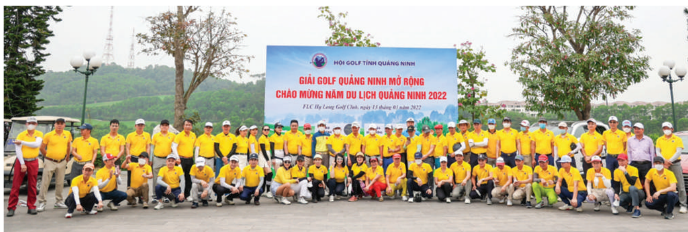
Quảng Ninh có tiềm năng du lịch golf chất lượng cao với nhiều sân golf tiêu chuẩn quốc tế. Ảnh chụp tại Quần thể nghỉ dưỡng FLC Hạ Long.

Ông Tùng nhận định, nếu như thể thao góp phần thúc đẩy sự phát triển của du lịch thì ngược lại, khi tổ chức các hoạt động thể thao - du lịch quy mô lớn, mở rộng phạm vi ở tầm quốc tế thì công tác tổ chức, chuyên môn để điều hành sự kiện đòi hỏi phải có chất lượng cao hơn. Cơ sở vật chất, các trang thiết bị thiết yếu đi kèm cũng đòi hỏi phải nâng cao, hoàn thiện hơn nữa thì mới đáp ứng yêu cầu. Qua đó, giúp các nhà quản lý chuyên môn có điều kiện nhìn lại công tác tổ chức, hướng tới sự chuyên nghiệp cao hơn trong thể thao.