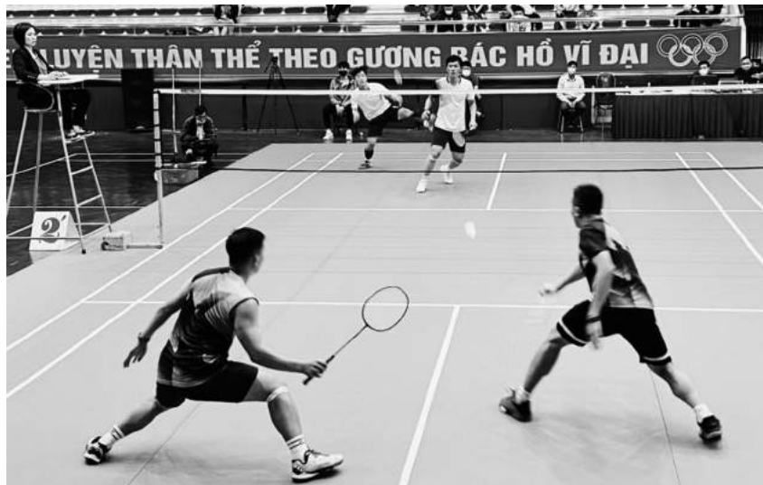
Trận chung kết nội dung đôi nam trong khuôn khổ Giải Cầu lông cá nhân, đồng đội Đại hội thể dục, thể thao tỉnh Quảng Ninh lần thứ IX năm 2021.

Điển hình, trong lĩnh vực thể thao quần chúng, việc thực hiện cuộc vận động "Toàn dân tập luyện theo gương Bác Hồ vĩ đại" gắn với phong trào "Toàn dân đoàn kết xây dựng đời sống văn hoá", xây dựng nếp sống văn minh được triển khai rộng rãi, tạo sức lan tỏa trong cộng đồng. Số người tập luyện thường xuyên hàng năm trung bình tăng 0,5-1%. Riêng năm 2021, số người tập luyện thể dục thể thao thường xuyên đạt 40% dân số; gia đình thể thao đạt 23% số hộ. Công tác tổ chức Đại hội Thể dục thể thao từ cấp cơ sở đến cấp tỉnh được triển khai đúng tiến độ, chất lượng. Đến nay, đã có hơn 90% số xã, phường, thị trấn tổ chức xong đại hội thể dục, thể thao cấp xã; 9/15 huyện, thị xã, thành phố và ngành tổ chức xong đại hội thể dục, thể thao cấp huyện; cấp tỉnh đã tổ chức xong