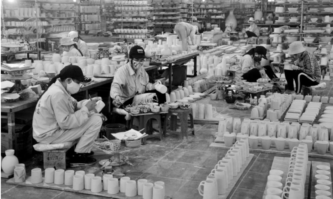
Lao động làng nghề được đảm bảo ổn định về việc làm, thu nhập.