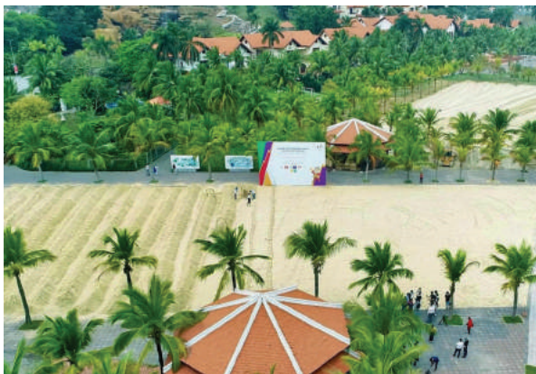
Khu du lịch quốc tế Tuần Châu là địa điểm được chọn là nơi tổ chức thi đấu môn bóng chuyền bãi biển.