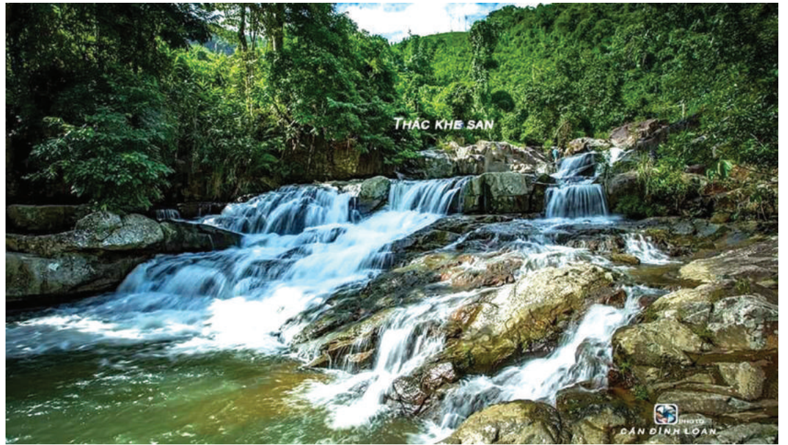
Thác Khe San.

tô, xe máy có thể vào gần đến nơi. Từ điểm đỗ xe, du khách rẽ xuống triển đồi là tới thác. Từ cách xa hàng trăm mét đã có thể nghe thấy tiếng nước thác Khe San rì rào, gợi cho du khách cảm giác gần gũi với thiên nhiên hơn.