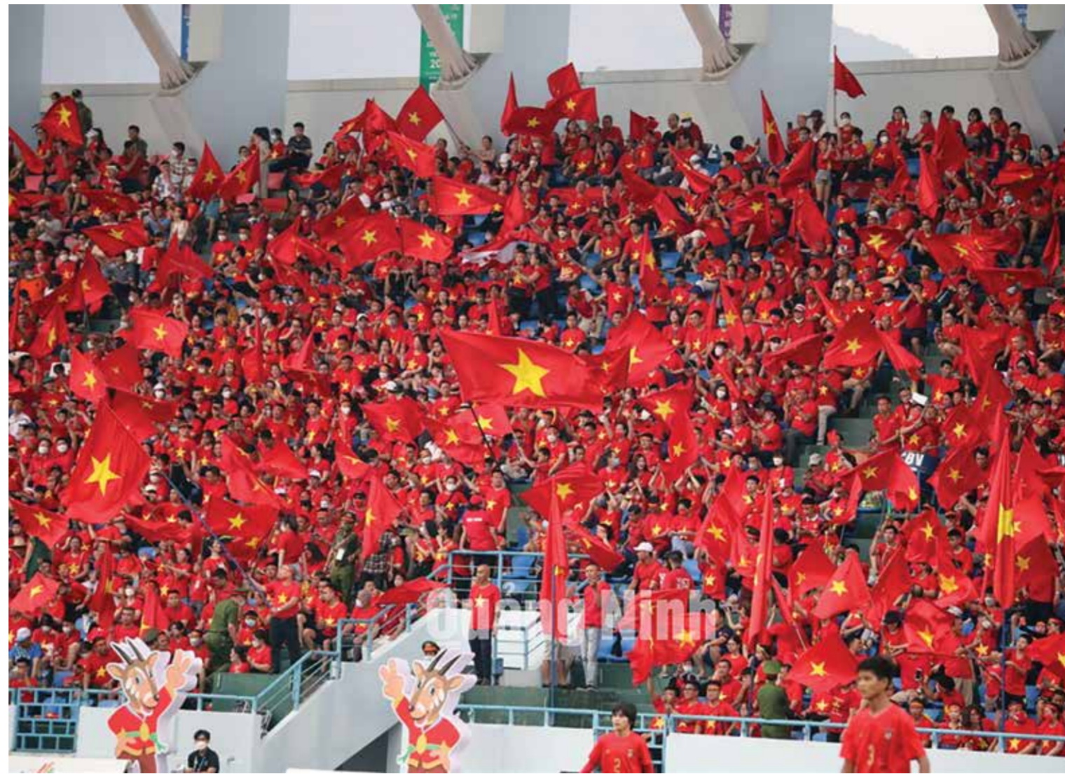
CDV Đất mở góp phần làm nên thành công của SEA Games 31 tại Quảng Ninh.