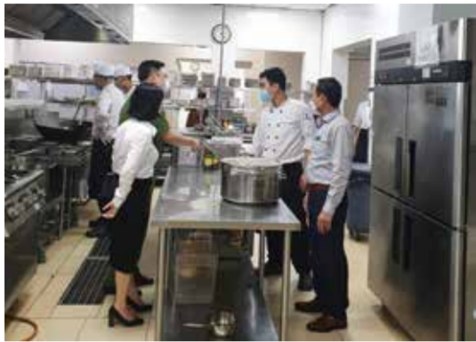
Bảo đảm an toàn thực phẩm phục vụ SEA Games 31.