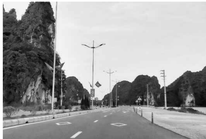
Tuyến đường bao biển Hạ Long, Cẩm Phả đưa vào sử dụng tiếp tục tạo động lực phát triển cho cả hai địa phương.

Đồng thời, Cẩm Phả còn tập trung phát triển du lịch, thương mại trên địa bàn. Ngày 19/5/2022, thành phố đã khai trương tuyến phố đi bộ tại phường Cẩm Tây nhằm tạo sản phẩm du lịch, văn hóa trải nghiệm theo hướng phát triển kinh tế ban đêm. Thành phố cũng đang chỉ đạo xây dựng các trung tâm du lịch trọng điểm trên