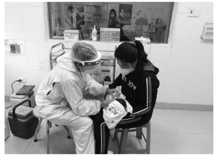
Chuẩn bị tiêm phòng cho trẻ em tại Bệnh viện Sản Nhi tỉnh.

Trung tâm Phòng chống bệnh tật tỉnh, trung tâm y tế các địa phương tăng cường giám sát phòng chống SDD