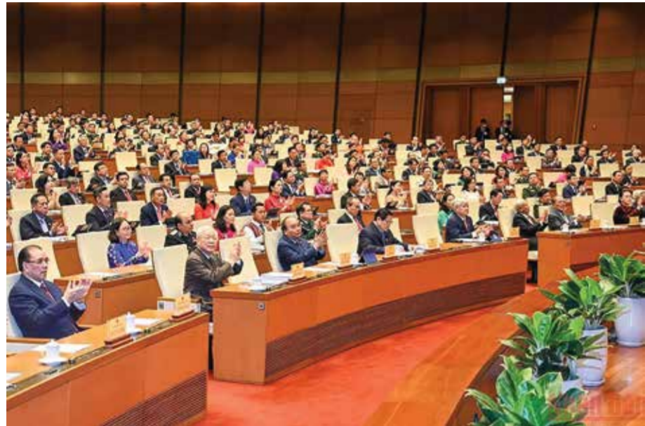
Các đại biểu dự phiên khai mạc Kỳ họp thứ 3, Quốc hội khóa XV.

Sáng 23/5, tại Nhà Quốc hội, Thủ đô Hà Nội, Kỳ họp thứ 3 của Quốc hội nước Cộng hòa XHCN Việt Nam khóa XV khai mạc trọng thể theo hình thức tập trung. Phiên khai mạc được phát thanh, truyền hình trực tiếp để cử tri và nhân dân cả nước theo dõi.