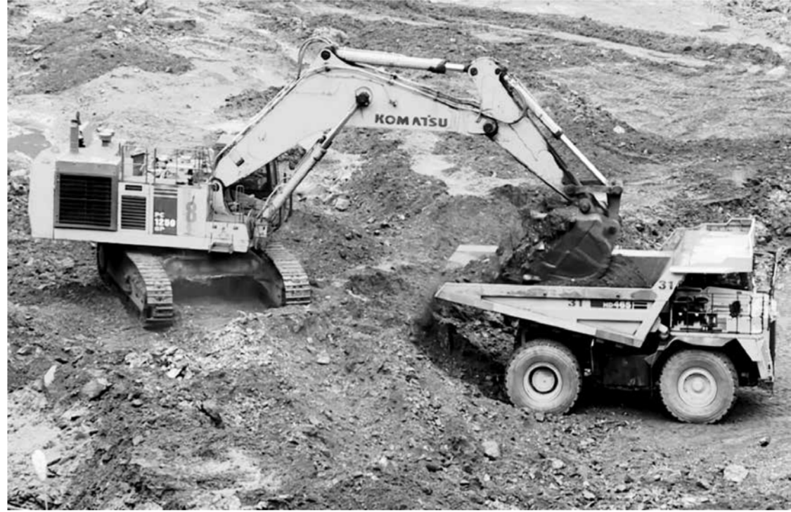
Công ty CP Than Đèo Nai - Vinacomin đẩy mạnh sản xuất.

Hàng năm Ban Thường vụ Thành ủy Cẩm Phả ban hành các kế hoạch, hướng dẫn, văn bản để lãnh đạo, chỉ đạo các chi, đảng bộ trực thuộc, tổ chức