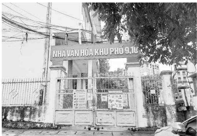
Khu 9, khu 10, phường Hồng Hải hiện sử dụng chung nhà văn hóa.

Vừa qua, các hộ dân trú tại tổ 5B, khu 10, phường Hồng Hải, TP Hạ Long có đơn đến tỉnh phản ánh, kiến nghị liên quan đến việc lập quy hoạch trong khu vực. Để giải quyết dứt điểm vụ việc, tỉnh đã chỉ đạo yêu cầu UBND TP Hạ Long nghiêm túc thực hiện.