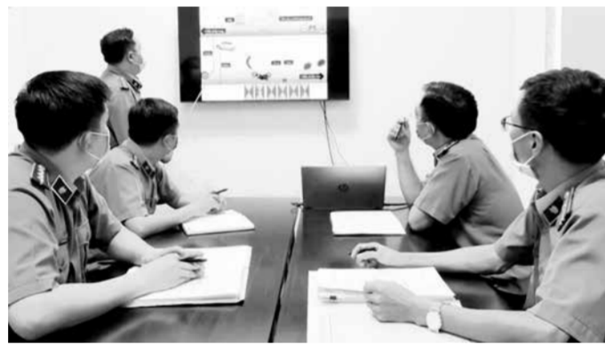
Viện KSNĐ thành phố báo cáo án bằng sơ đồ hóa.

truyền. Nhờ làm tốt công tác tuyên truyền, giáo dục tư tưởng, đạo đức cho đội ngũ cán bộ, đảng viên nên việc học và làm theo Bác đã trở thành việc làm thường xuyên của cán bộ, đảng viên, nhân viên đơn vị.