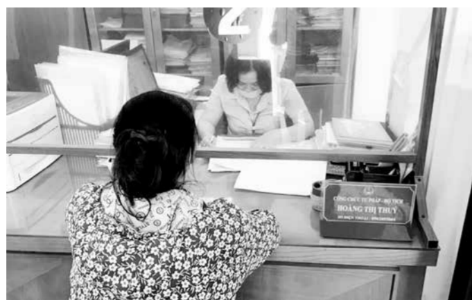
Cán bộ phường Cửa Ông kiểm tra hồ sơ hành chính của người dân.

thời Bác Hồ đã dạy chăm sóc sức khỏe cho nhân dân là nhiệm vụ cao cả. Là đảng viên, cán bộ, nhân viên y tế, bà luôn nỗ lực không ngừng học và làm theo lời dạy của Bác. Trăm mưa lớn ngày 24/9/2021 đã gây ra ngập úng cục bộ; trên địa bàn phường có một người dân đang tham gia giao thông bị rách cơ bắp chân phải, máu chảy nhều. Bệnh nhân được người dân đưa vào Trạm y tế phường trong tình trạng huyết áp tụt nhanh chỉ còn