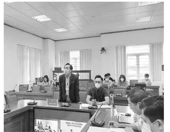
Công dân trình bày nội dung khiếu nại với Hội đồng Tiếp công dân tỉnh tại buổi tiếp công dân định kỳ của UBND tỉnh, tháng 5/2022.

UBND tỉnh đã giao Thanh tra tỉnh xác minh làm rõ nội dung khiếu nại, tổ chức đối thoại và báo cáo kết quả