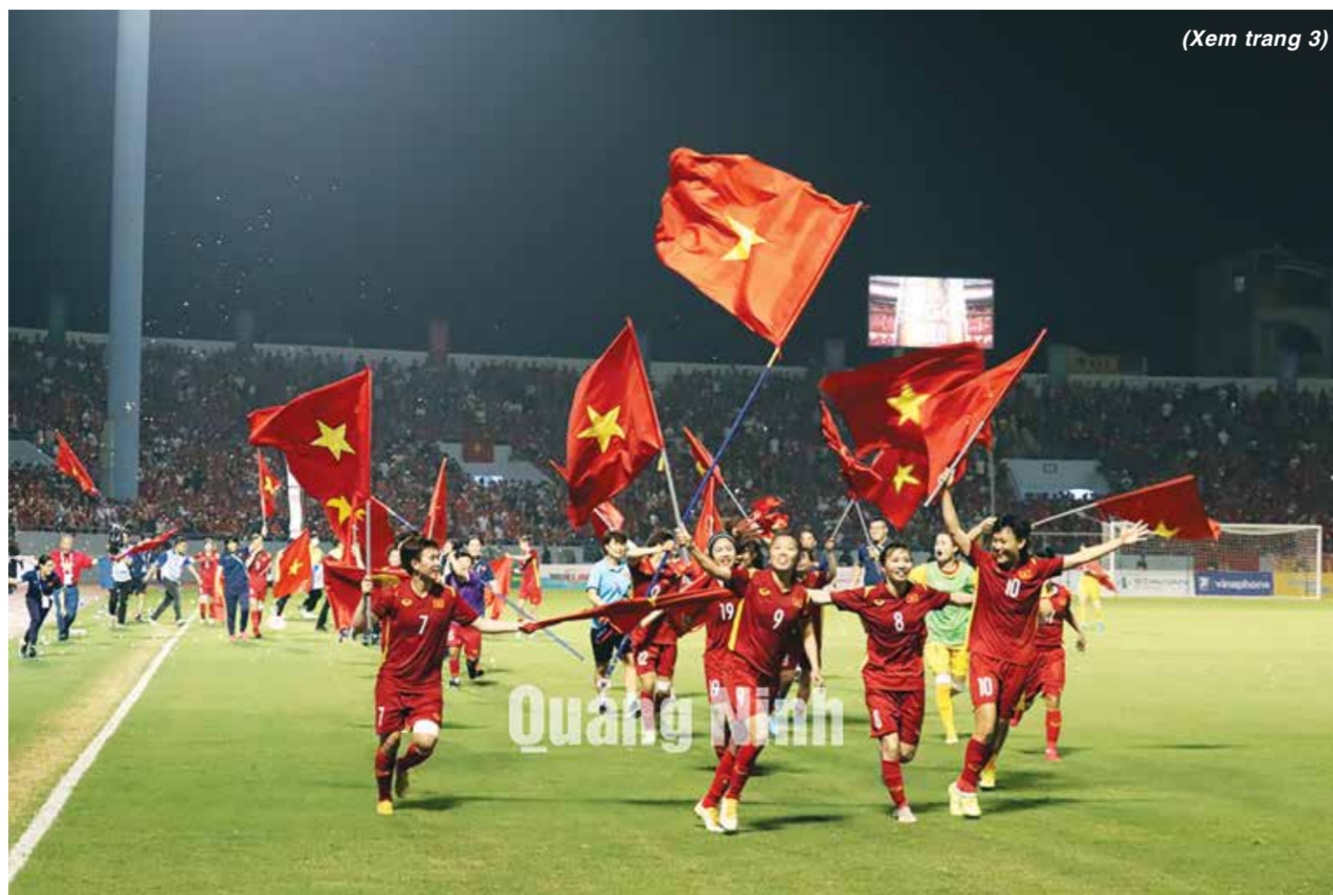
(Xem trang 3)