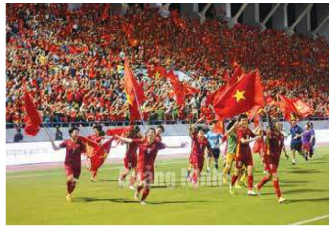
Đội tuyển bóng đá nữ quốc gia giành HCV SEA Games trên SVD Cẩm Phả.