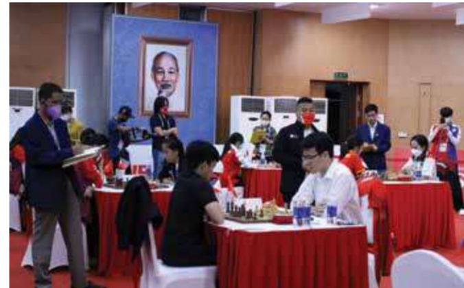
Thi đấu nội dung cờ chớp đồng đội tại Cung Quy hoạch, Hội chợ và Triển lãm tỉnh.