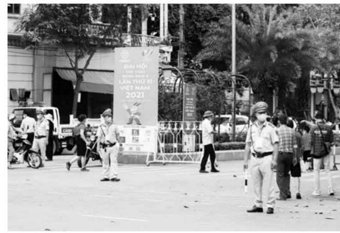
Công tác đảm bảo ATGT, an ninh trật tự tại các khu vực diễn ra SEA Games 31.