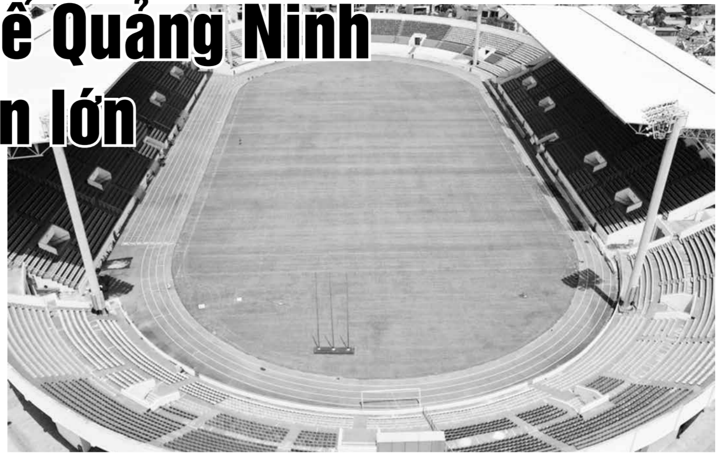
SVD Cẩm Phả nơi diễn ra các trận thi đấu bóng đá nữ được đầu tư đồng bộ, tổng thể và mặt sân được thay mới đáp ứng tiêu chuẩn thi đấu quốc tế.

Bà Đào Thúy Hằng, TP Cẩm Phả chia sẻ: SVD Cẩm Phả đã thực sự “lột xác”, khi trước đây các điều kiện chỉ đủ để đáp ứng các trận đấu bóng đá tiếp tục đi lên và giành thêm nhiều thành tích cao hơn nữa.