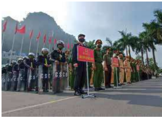
Công an tỉnh ra quân đảm bảo ANTT, ATGT tại SEA Games 31.