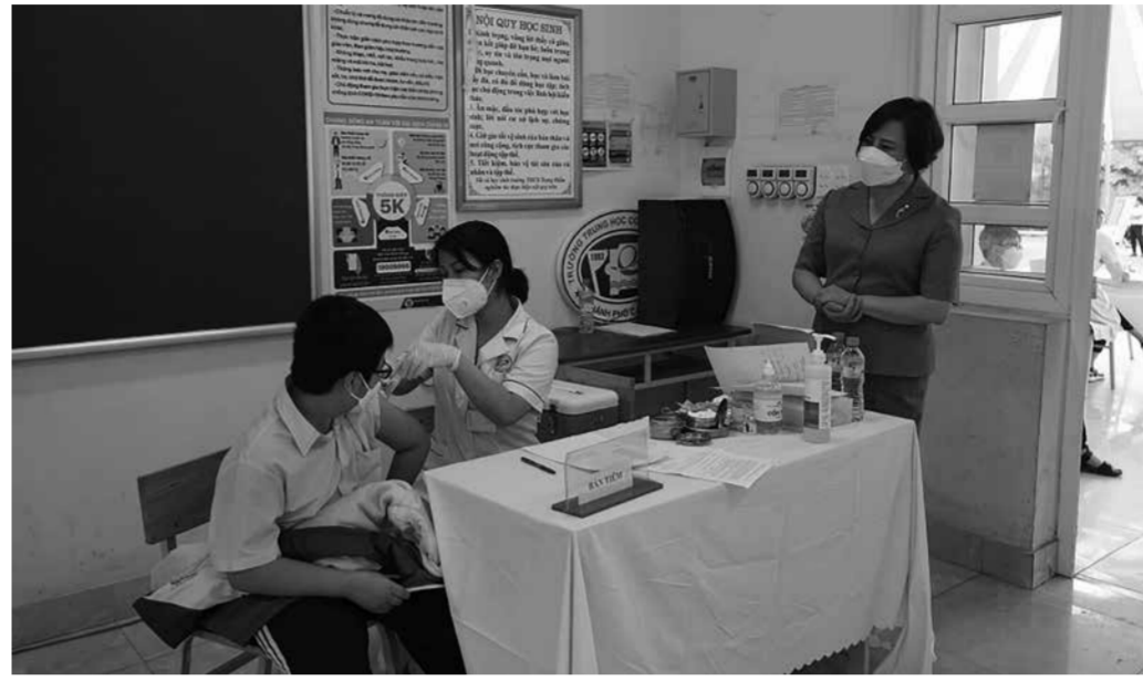
Lãnh đạo Thành ủy Cẩm Phả kiểm tra công tác tiêm chủng vắc-xin phòng dịch Covid-19 tại điểm tiêm Trường THCS Trọng Điểm.

Từ đầu năm đến nay, Huyện ủy Tiên Yên đã ban hành 2 chỉ thị, 56 quyết định, 4 chương trình, 28 kế hoạch, 70 thông báo, 21 thông báo kết luận... cùng nhiều văn bản có liên quan để lãnh đạo, chỉ đạo công tác xây dựng Đảng, xây dựng hệ thống chính trị; xây dựng huyện nông thôn mới (NTM) nâng cao, xã NTM nâng cao, kiểu mẫu; thực hiện sơ, sắp xếp, sáp nhập thôn, khu phố của các xã, thị trấn; thực hiện "mục tiêu kép" và phát triển kinh tế - xã hội, vừa phòng, chống dịch Covid-19... Huyện tập trung chỉ đạo triển khai đồng bộ, quyết liệt, hiệu quả các biện pháp phòng tránh lây