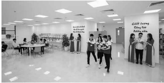
Một góc thư viện Trường Đại học Hà Nội.

Để tiếp tục đẩy mạnh, nâng cao chất lượng đào tạo sau đại học nhất là đào tạo trình độ tiến sĩ, Thủ tướng Chính phủ chỉ thị Bộ GD&ĐT tăng cường thực hiện đồng