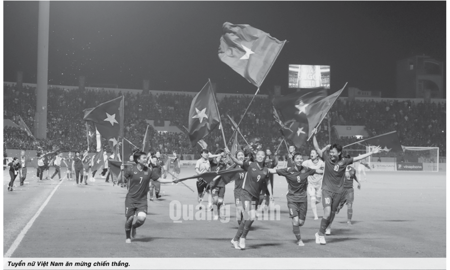
Tuyển nữ Việt Nam ăn mừng chiến thắng.

ưu tú, có trình độ, khả năng giao tiếp bằng tiếng Anh, tiếng Trung và một số ngôn ngữ được sử dụng phổ biến trong khu vực Đông Nam Á.