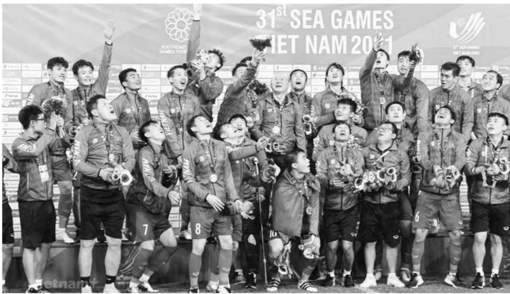
HLV Park Hang Seo vẫn là người hiếm có khó tìm của bóng đá Việt Nam.

Điều này đã tạo cơ hội cho U23 Việt Nam có bóng nhiều hơn. Khi đó, HLV Park Hang Seo yêu cầu các học trò chuyển thể nhanh để tạo ra cơ hội cho tuyển trên. Chiến thuật này khác hẳn với hiệp 1, thời điểm các cầu thủ U23 Việt Nam lên bóng khá chậm và đánh mất nhiều cơ hội.