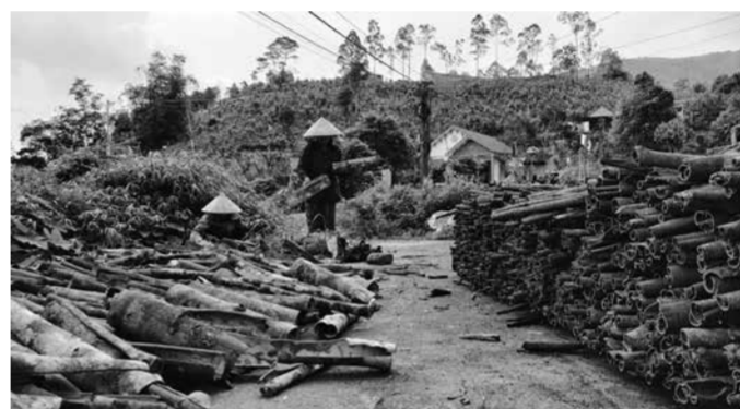
Người dân huyện Tiên Yên thu hoạch cây quế, tháng 4/2022.