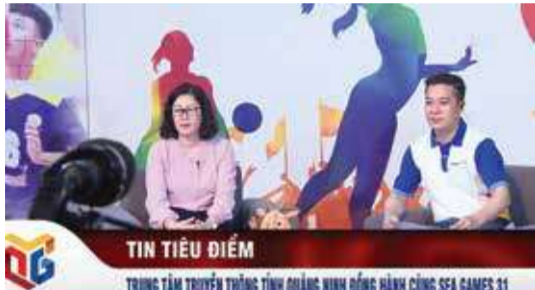
Trung tâm Truyền thông tỉnh thực hiện nhiều chương trình đặc sắc đồng hành cùng SEA Games 31.