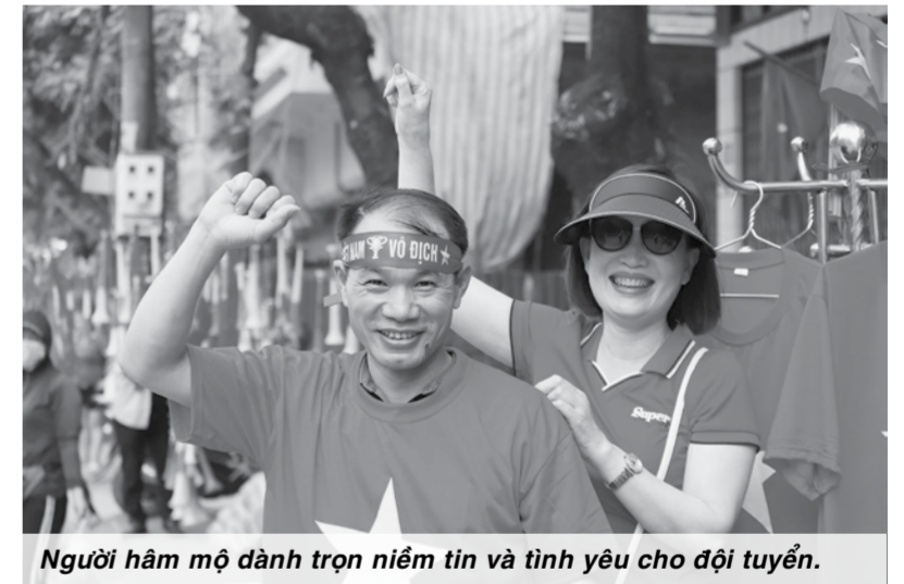
Người hâm mộ dành trọn niềm tin và tình yêu cho đội tuyển.