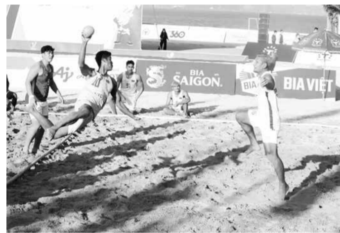
Mặt sân cát thi đấu bóng ném bãi biển nam được chuẩn bị kỹ lưỡng, đảm bảo tiêu chuẩn thi đấu.