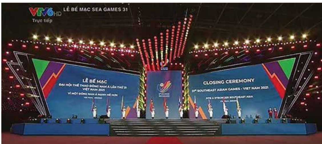
Sau 12 ngày tranh tài sôi nổi, SEA Games 31 chính thức khép lại với Lễ bế mạc tối 23/5 gồm nhiều chương trình nghệ thuật âm nhạc đặc sắc.