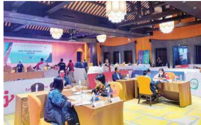
Thi đấu cờ tướng tại khu nghỉ dưỡng Legacy Yên Tử (TP Uông Bí).

PHÒNG BIÊN TẬP BÁO QUẢNG NINH - BÁO HẠ LONG (Tổng hợp)