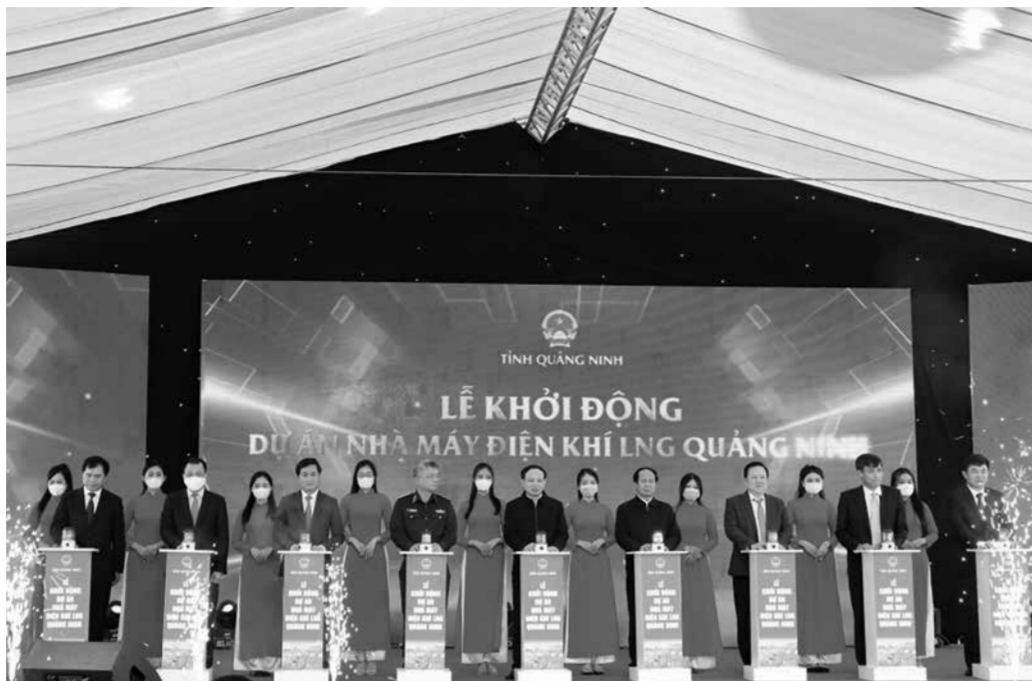
Các đồng chí lãnh đạo Trung ương, tỉnh Quảng Ninh và chủ đầu tư dự án bấm nút khởi động Dự án Nhà máy Điện khí LNG Quảng Ninh tại phường Cẩm Thịnh, TP Cẩm Phả.

Đi đôi với đó, thành phố cũng chú trọng thu hút đầu tư, tháo gỡ khó khăn cho doanh nghiệp, nhất là doanh nghiệp bị ảnh hưởng bởi dịch Covid-19; tích cực hỗ trợ, tạo điều kiện cho các nhà đầu tư nghiên cứu, triển khai các dự án lớn mang tính động lực, trọng điểm phục vụ phát triển kinh tế - xã hội của tỉnh và địa phương. Năm 2021, Cẩm Phả có 304 doanh nghiệp, 4 hợp tác xã mới thành lập. Thành phố cũng đã tổ chức thành công lễ khởi động Nhà máy điện khí LNG Quảng Ninh tại phường Cẩm Thịnh, Khánh