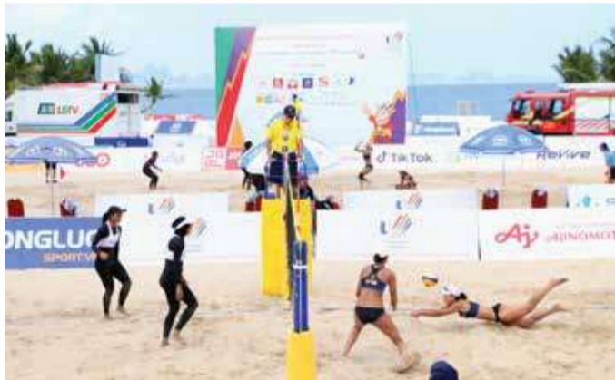
Thi đấu bóng chuyền bãi biển nữ tại Khu du lịch quốc tế Tuần Châu (TP Hạ Long).