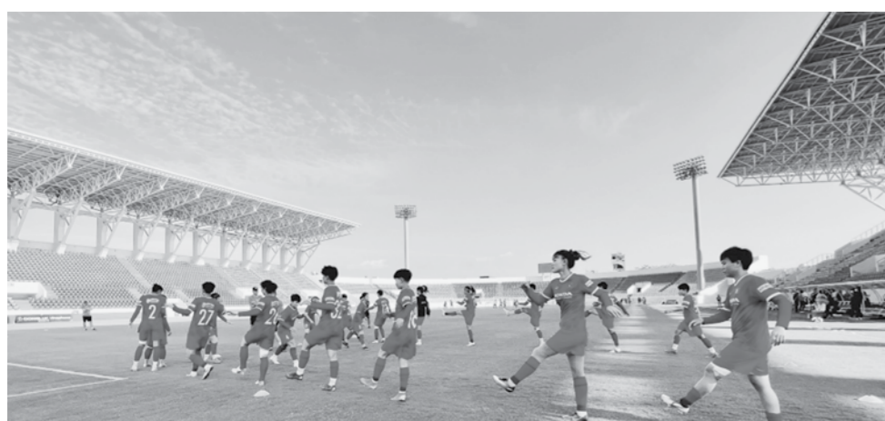
SVD Cẩm Phả (TP Cẩm Phả) nơi diễn ra tất cả các trận đấu trong khuôn khổ môn Bóng đá nữ SEA Games 31 lần này. Các chuyên gia Liên đoàn bóng đá Việt Nam đánh giá, SVD Cẩm Phả hiện tại hoàn toàn đáp ứng đủ các điều kiện để tổ chức các trận đấu tầm cỡ quốc tế.

Để góp phần vào thành công của kỳ SEA Games lần này, hơn 300 tình nguyện viên là những sinh viên của Trường Đại học Hạ Long đã được tham dự các khóa tập huấn đặc biệt. Đây là những sinh viên