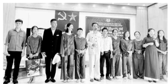
Trường THCS Cẩm Thịnh sinh hoạt chuyên đề tháng 5/2022 "Học Bác lòng ta trong sáng hơn".