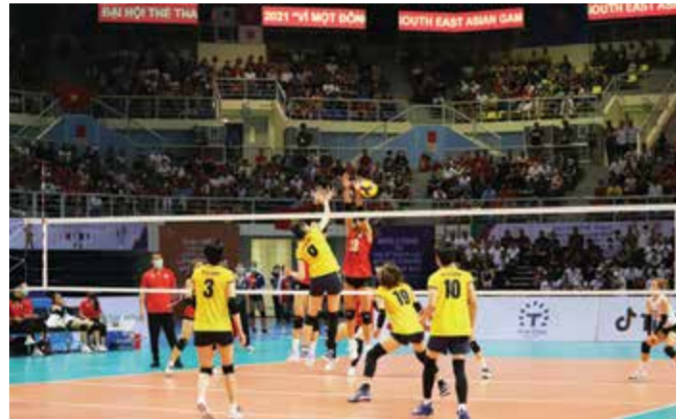
Chung kết bóng chuyền nữ giữa Đội tuyển Việt Nam và Đội tuyển Thái Lan tại Nhà thi đấu đa năng 5.000 chỗ (TP Hạ Long).