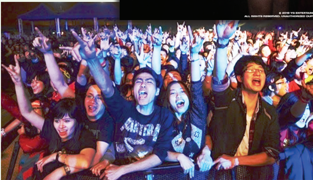
Cuồng “thần tượng” dễ gây ra nhiều hệ lụy đối với giới trẻ.