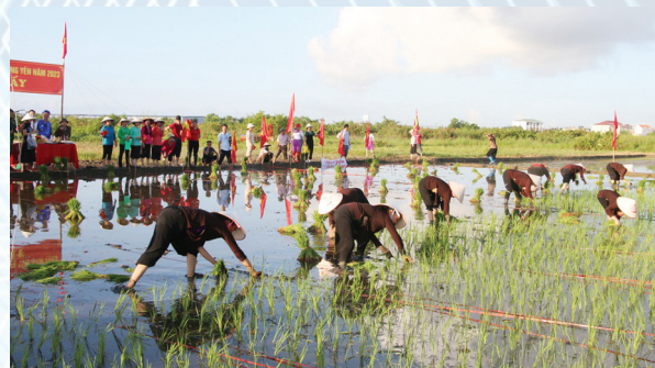
Hội thi cấy có sự tham gia của 15 thí sinh của hai phường Phong Cốc và Phong Hải.