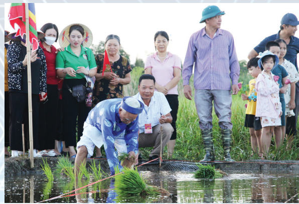
Ông chủ tế xuống ruộng trước của đình Cốc cấy những cây lúa đầu tiên trước sự chứng kiến của dân làng.