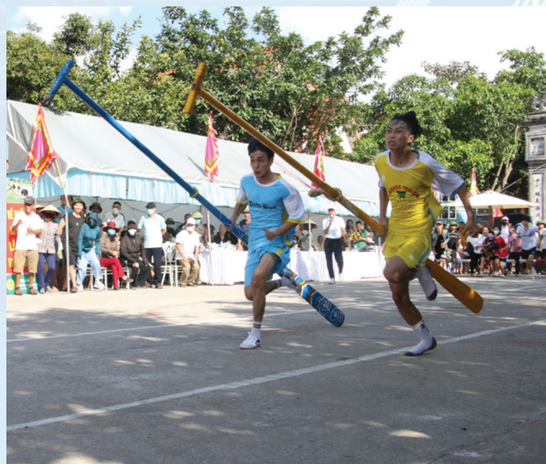
Bắt đầu một keo bơi chài, vận động viên của các đội sẽ cầm sào hoặc mái chèo chạy thật nhanh để trao cho các thành viên của đội.

Trong hai ngày 22 và 23/7/2023, tại khu vực đình Cốc (phường Phong Cốc) đã diễn ra Lễ hội Xuống đồng ở TX Quảng Yên năm 2023. Theo tín ngưỡng dân gian, lễ hội được tổ chức nhằm biểu thị lòng biết ơn của người dân đối với các vị Thần Nông và thành hoàng làng phù hộ cho mùa màng tốt tươi. Bên cạnh phần lễ, phần hội diễn ra nhiều hoạt động như thi cấy, đua thuyền chài trên sông Cửa Đình đã thu hút sự tham gia của đông đảo người dân và du khách.