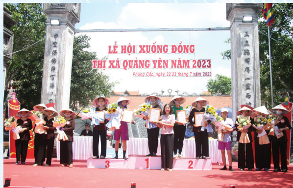
Ban Tổ chức trao các giải thi cấy. Tiêu chí xét giải là cấy nhanh nhất nhưng cây mạ phải thẳng hàng, khoảng cách đều, không bị đổ gãy.