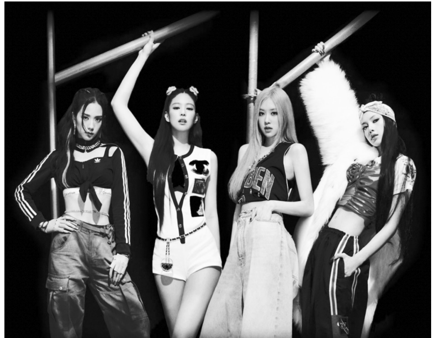
Thông tin nhóm nhạc nổi tiếng Hàn Quốc Blackpink đến Việt Nam biểu diễn làm nóng những câu chuyện bàn về văn hóa thần tượng trong giới trẻ hiện nay.