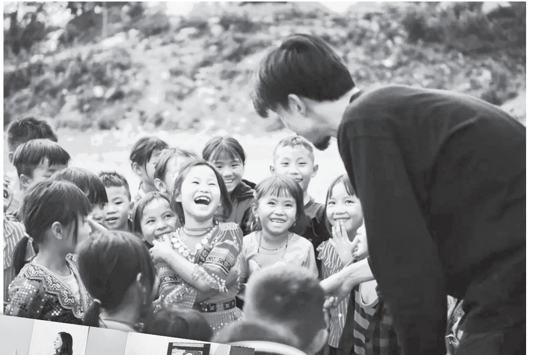
Hình ảnh đẹp của rapper Đen Vâu khi anh trích 500 triệu ủng hộ trẻ em vùng sâu xa.

Rõ ràng có thể thấy việc hâm mộ thần tượng đem lại lối sống, động lực tích cực rất đáng hoan nghênh. Tuy nhiên không vì hâm mộ thái quá, cuồng mà các bạn trẻ thiếu tỉnh