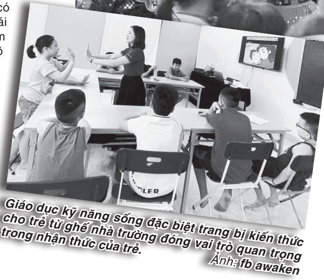
Giáo dục kỹ năng sống đặc biệt trang bị kiến thức cho trẻ từ ghế nhà trường đóng vai trò quan trọng trong nhận thức của trẻ.