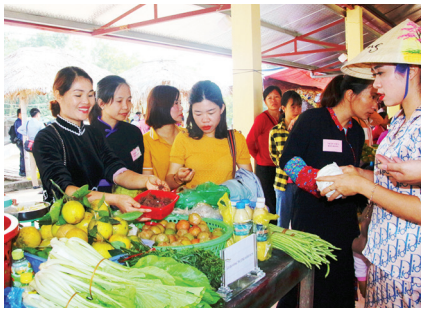
Du khách tham quan và mua sắm nông, đặc sản địa phương ở chợ phiên Hà Lâu.

phiên cần được quan tâm đầu tư hoặc mở rộng kết nối không gian để trở thành sản phẩm hoặc điểm đến đủ giữ chân du khách. Để tăng sức hút du khách tới chợ phiên, được biết huyện Bình Liêu đã có kế hoạch chỉnh trang, xây dựng lại chợ Đông Văn; tổ chức các lễ Kiêng gió, Đông khản... thành những lễ hội lớn. Chợ cũng được quan tâm kết nối với các tour biên giới, tham quan Sông Moóc, Khe Tiên, Cột mốc... Trong tương lai, chợ Đông Văn được nghiên cứu quy hoạch thành chợ vùng cao biên giới, kết hợp du lịch biên giới với nước bạn và các tỉnh Cao Bằng - Lạng Sơn - Hà Giang.