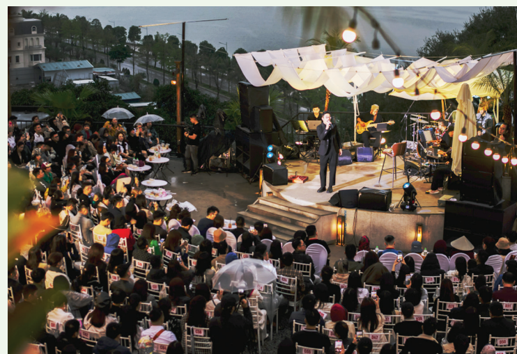
Show ca nhạc được tổ chức tại Tổ hợp Đôi Mặt trời (TP Hạ Long).

điểm một tháng trước. Ở trong nước, lượng tìm kiếm về điểm lưu trú của Hà Nội cũng cao gấp 14 lần từ khi chính thức bán vé. Cùng với đó, Quảng Ninh và Vịnh Hạ Long cũng được tìm kiếm khá nhiều trên trang mạng xã hội Weibo của Trung Quốc bởi nhiều người trẻ Trung Quốc muốn kết hợp tour xem buổi biểu diễn của nhóm nhạc Blackpink tại Hà Nội đồng thời du lịch Hạ Long dịp này.