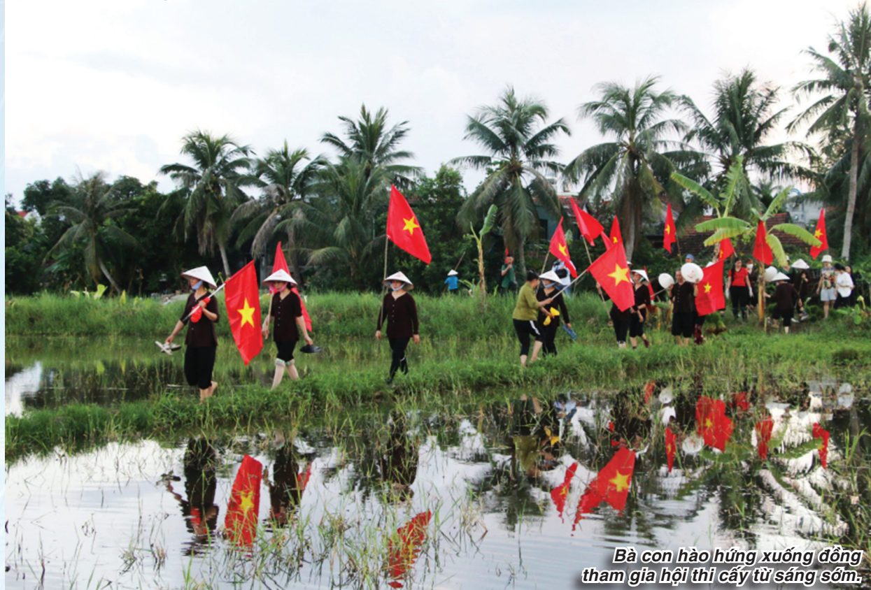
Bà con hào hứng xuống đồng tham gia hội thi cấy từ sáng sớm.