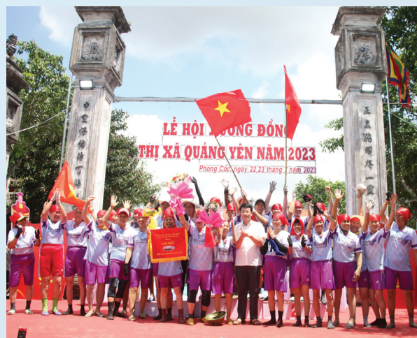
Đội thi số 4 phường Phong Hải giành giải nhất nội dung đua thuyền nữ. Ở giải nam, giành giải nhất là Đội thi số 2 phường Phong Cốc.