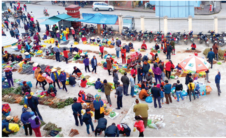
Một phiên chợ trung tâm thị trấn Bình Liêu dịp cuối năm.

Ngoài cảnh sắc thiên nhiên tươi đẹp, các chợ phiên đậm bản sắc của bà con dân tộc là yếu tố tăng sức hấp dẫn cho hành trình của du khách. Đây là nguồn tài nguyên cần quan tâm, đầu tư, phát huy giá trị.