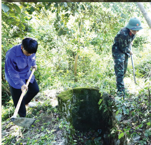
Hệ thống hầm hào của Đồn Cao còn nguyên dấu tích.