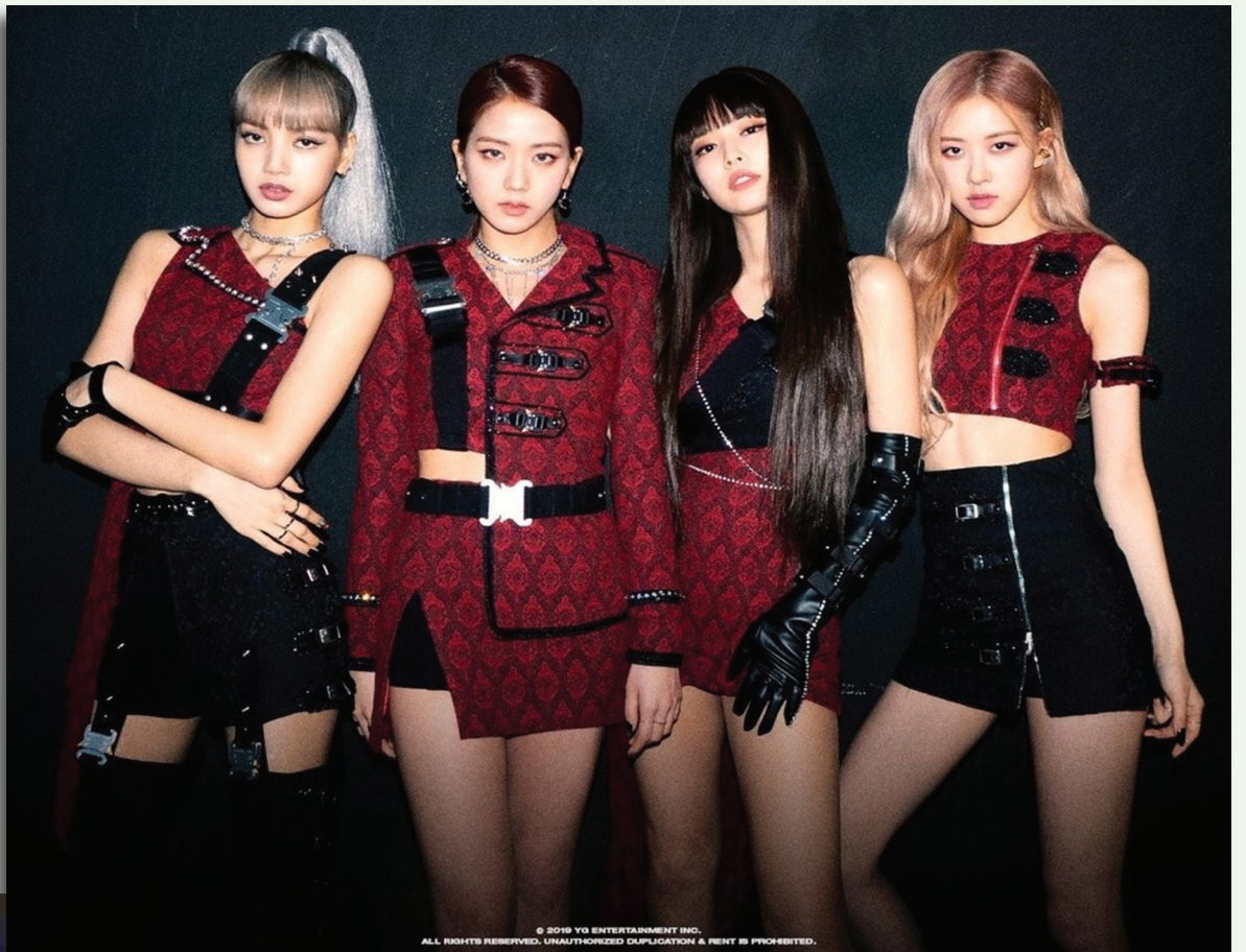
Nhóm nhạc Blackpink đang là thần tượng của nhiều bạn trẻ Việt Nam.