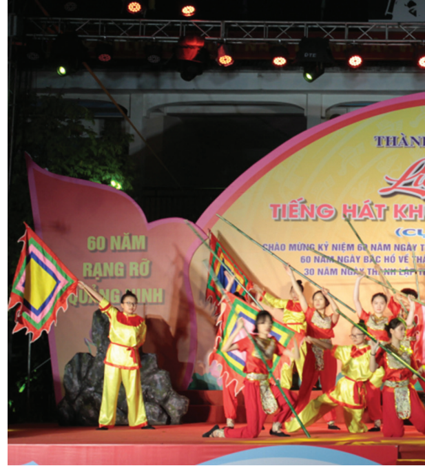
Tiết mục "Hào khí Việt Nam" mở màn Liên hoan văn nghệ khu dân cư TP Hạ Long.

Từ tháng 5 đến tháng 8/2023, Liên hoan Tiếng hát khu dân cư TP Hạ Long quy tụ hàng trăm tiết mục ca, múa, nhạc, tiểu phẩm của các nghệ sĩ, diễn viên không chuyên trên địa bàn.