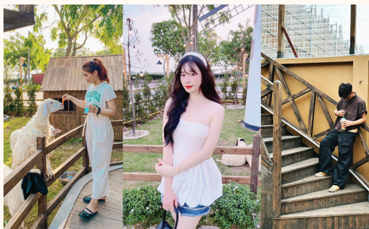
Góc check-in phong phú dành cho du khách khi đến với Yên Forest.

Nếu có dịp về Bạch Đằng Giang - quê hương của những nét đẹp văn hóa, lễ hội truyền thống thì bạn hãy thử ghé qua Yên Forest để cảm nhận một không gian Đà Lạt cực "chill" ngay giữa lòng Quảng Yên nhé!