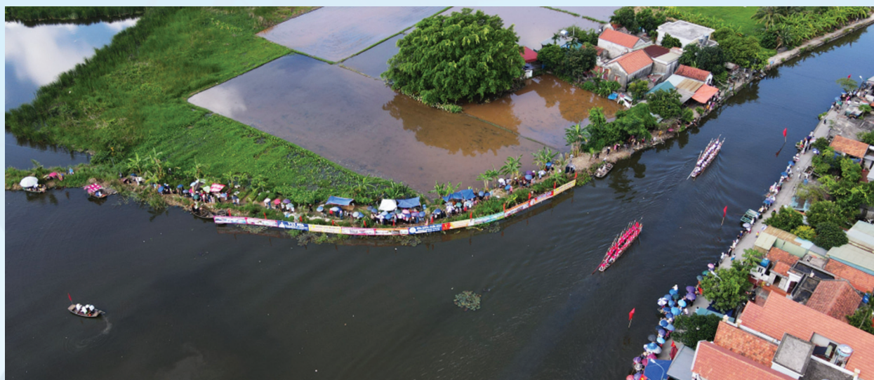
Các đội thi đua thuyền vòng quanh sông Cửa Đình.