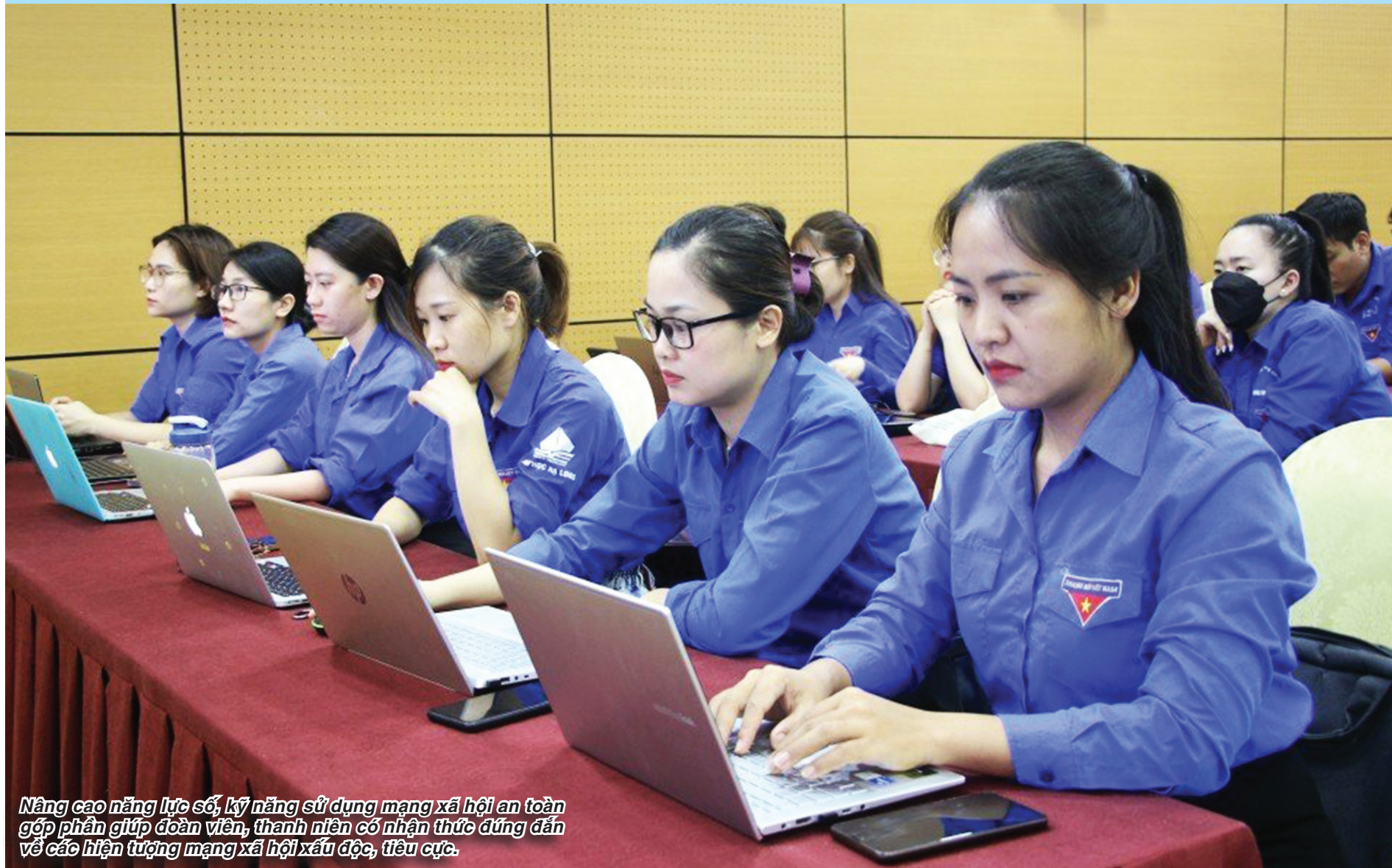
Nâng cao năng lực số, kỹ năng sử dụng mạng xã hội an toàn góp phần giúp đoàn viên, thanh niên có nhận thức đúng đắn về các hiện tượng mạng xã hội xấu độc, tiêu cực.

Năm thứ 59 Số: 1107 (1155) 30 7/2023 (13, Tháng 6, Quý Mão)