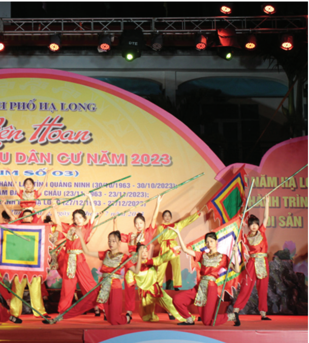
Ảnh thi số 3.

Liên hoan TP Hạ Long đã diễn ra sôi nổi tại các nhà văn hóa khu vực của thành phố.