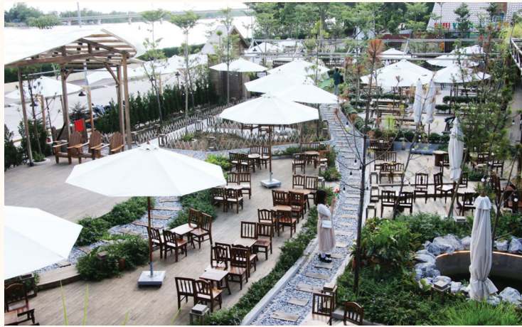
Yên Forest với không gian rộng rãi và thiết kế mang phong cách Đà Lạt.

2.000m 2 , Yên Forest hiện được chia thành các khu vực dịch vụ gồm: Khu vườn cà phê, bánh ngọt; khu vườn ẩm thực; khu vườn tuổi thơ (nhà vui chơi dành cho trẻ em); khu lều camping (phục vụ du khách check-in) và khu nông trại (nuôi cừu, hồ cá koi). Do đó, các dịch vụ tại đây có thể đáp ứng nhu cầu vui chơi của mọi độ tuổi từ thiếu nhi, thanh niên đến các bậc phụ huynh. Đặc biệt, với việc bố trí nhiều khu vực nên nơi đây tại Yên Forest cũng đều có thể trở thành điểm check-in thú vị cho khách hàng.