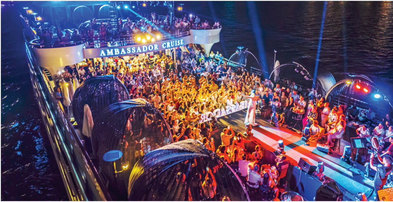
Các show ca nhạc thu hút đông đảo khán giả địa phương và du khách thưởng thức.