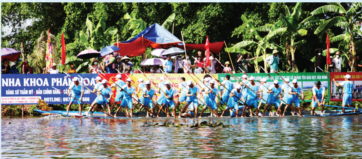
Hội đua thuyền chài truyền thống là hoạt động được mong chờ nhất của lễ hội.